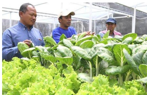
Gambar 7 Kampung Hidroponik

Kampung hidroponik merupakan kampung yang sebagian besar warganya menjadi petani hidroponik. Diawali dari hobi yang kemudian mendapatkan income bagi warga. Kampung hidroponik ini seluruhnya dikelola oleh warga bekerjasama dengan bank swasta dalam pengembangannya. Dan selanjutnya Pemkot Surabaya akan turun tangan untuk membantu mengembangkan kampung hidroponik tersebut. Partisipasi warga tidak hanya dalam kegiatan bertani melainkan juga dalam pengelolaannya sehingga dapat mendatangkan keuntungan bagi warga juga.