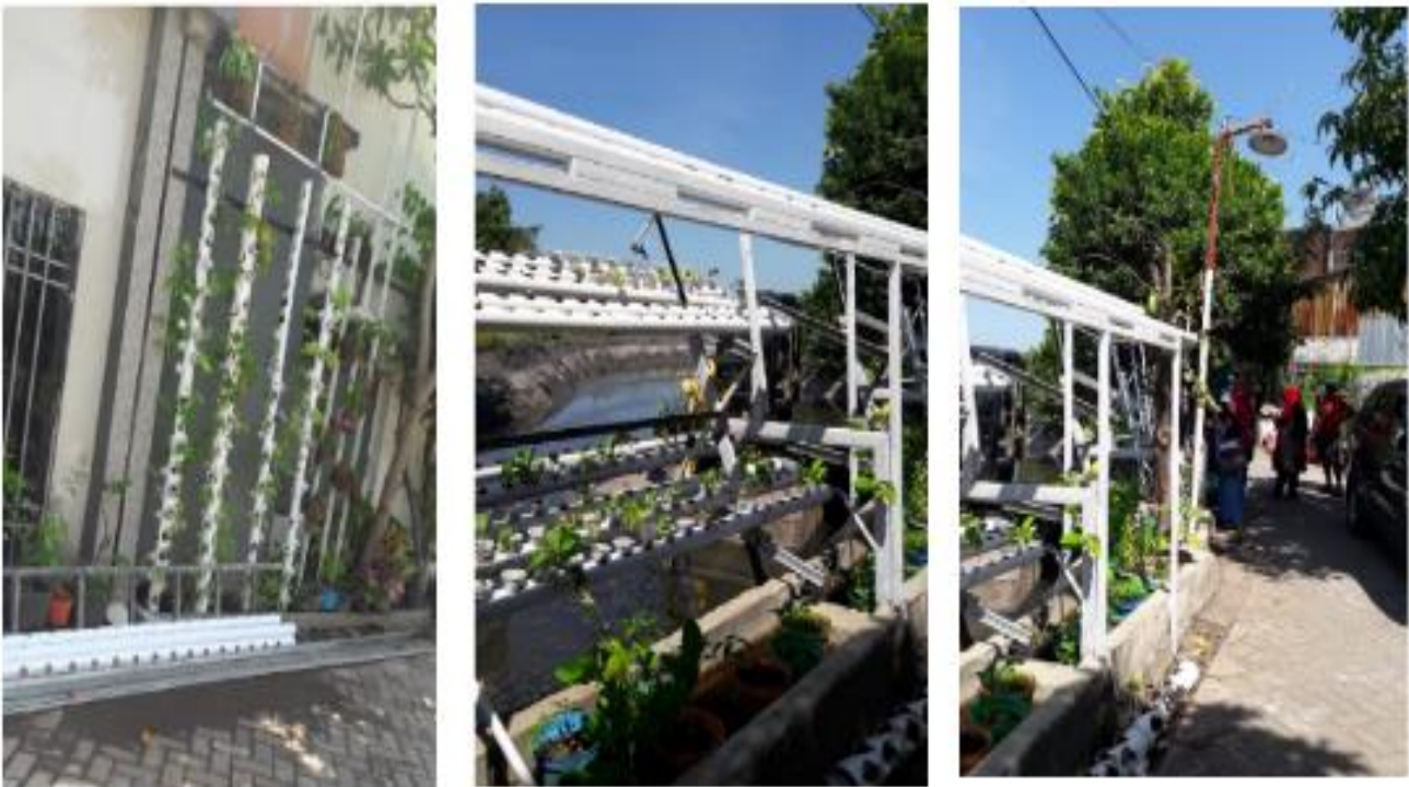
Gambar 3 Kampung Hidroponik

Kampung hidrop onik di Kelurahan Medokan Ayu tepatnya berada di RW XII. Kampung hidroponik telah mampu memberikan oase ditengah lingkungan padat penduduk di kota Surabaya. Kampung ini merupakan upaya dari warga sekitar yang memiliki kesamaan hobby untuk menjadi petani hidroponik. Bekerjasama dengan Bank Swasta kampung hidroponik di Medokan Ayu ini menjadi lebih banyak pengembangannya dalam bertani hidroponik. Tidak hanya sayuran tetapi buah-buahan juga ditanam dengan system hidroponik. Kampung hidroponik nantinya akan dikolaborasikan dengan memanfaatkan aliran sungai sebagai salah satu alternative dalam menikmati berwisata hidroponik.