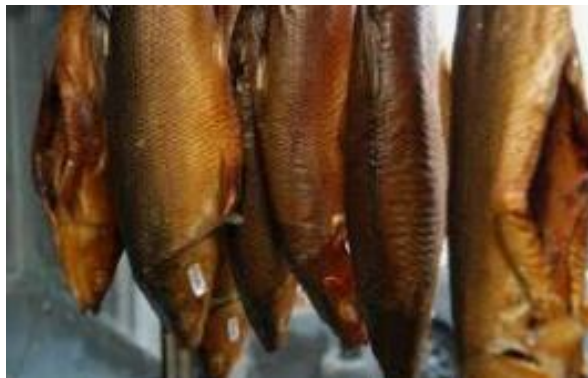
Gambar 5 Bandeng Asap

Medokan Ayu merupakan salah satu Kelurahan di Surabaya yang memiliki potensi sebagai penghasil bandeng. Bandeng yang dihasilkan di Medokan Ayu merupakan bandeng asli dari tambak warga. Kelebihan dari bandeng yang dihasilkan di Medokan Ayu adalah dagingnya yang empuk dengan tekstur yang lembut dan warna yang ayu (cantik) (Cak Sur, 2011). Produk-produk olahan bandeng juga dipasarkan oleh warga Medokan Ayu mulai dari bandeng asap, otak-otak bandeng dan bandeng sapit. Potensi tersebut bisa dikembangkan menjadi wisata tambak dan juga wisata kuliner yang tetap mengedepankan konsep ekowisata. Kuliner bandeng dan tambak bandeng menjadi bagian dari budaya warga Medokan Ayu karena berkaitan dengan ciri khas dan kebiasaan yang pada akhirnya menghasilkan identitas. Sehingga yang lebih ditonjolkan pada wisata bandeng adalah aspek budaya yang kemudian dikolaborasikan dengan aspek alam.