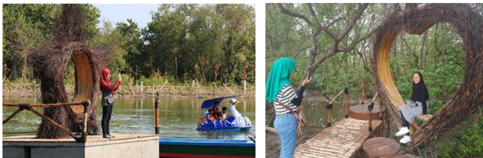
Gambar 6 Wisata Mangrove Medokan Ayu

Pengelolaan wisata mangrove ini masih didominasi oleh Pemkot Surabaya karena merupakan area konservasi dimana flora dan faunanya dilindungi oleh negara. Sehingga partisipasi masyarakat masih minim dalam pengelolaannya. Meskipun dalam wisata mangrove terdapat tambak yang dimiliki oleh warga dalam waktu dekat akan dikelola oleh Pemkot karena masuk dalam area konservasi.