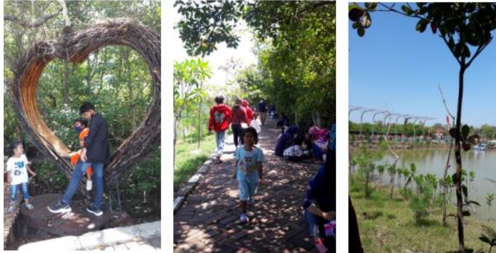
Gambar 4 Wisata Mangrove