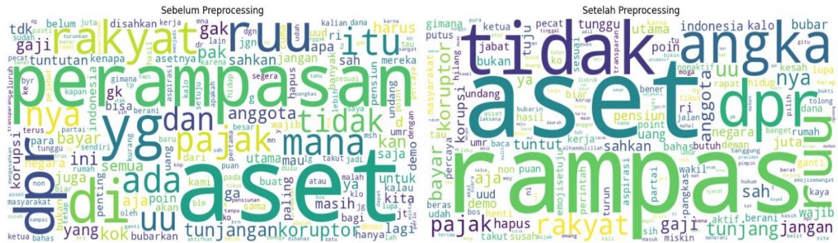
Gambar 2. Wordcloud

Wordcloud pada penelitian ini merepresentasikan distribusi frekuensi kata dalam dataset yang dianalisis. Semakin besar ukuran kata, semakin sering kata tersebut muncul dalam data, sehingga dapat diinterpretasikan sebagai topik atau isu yang paling dominan dalam data. Dari hasil wordcloud, terlihat bahwa terdapat beberapa kata kunci yang memiliki frekuensi tinggi dan menjadi pusat pembahasan, seperti “rampas”, “aset”, dan “dpr”. Hal ini menunjukkan bahwa dataset banyak memuat opini atau diskusi yang berkaitan dengan isu kebijakan publik dan ekonomi.