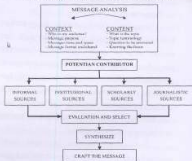
Bagan 1 The Message Analysis Information Strategic Model