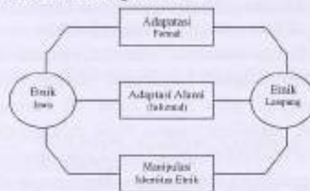
Gambar: Model Adaptasi Etnik Jawa pada Etnik Lampung

Hasil penelitian menunjukkan bahwa untuk mewujudkan interaksi yang harmonis dan alami dengan etnik Lampung, masyarakat Jawa menggunakan tiga strategi adaptasi terhadap etnik Lampung, yaitu adaptasi formal , adaptasi alami (informal) , dan manipulasi identitas etnik . Tiga strategi adaptasi yang dilakukan oleh etnik Jawa terhadap etnik Lampung tersebut secara skematik dapat digambarkan sebagai berikut: