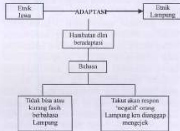
Gambar: Bahasa sebagai Hambatan dalam Beradaptasi Etnik Jawa

Bagi komunitas pendatang, beradaptasi dan berinteraksi dengan masyarakat asli memiliki tantangan dan hambatan tersendiri karena perbedaan budaya membuat interaksi antara pendatang dengan penduduk asli sedikit banyak mempengaruhi dinamika interaksi di antara mereka. Hal inilah yang dialami oleh Lampung Selatan. Berdasarkan hasil penelitian ditemukan minimal tiga hambatan yang dirasakan masyarakat Jawa warga transmigrasi ketika beradaptasi atau berinteraksi dengan komunitas Lampung. Ketiga hambatan tersebut adalah hambatan bahasa, hambatan psikis, dan hambatan sosial-budaya. Khusus yang berkaitan dengan hambatan bahasa dapat dilihat dari gambar berikut ini: