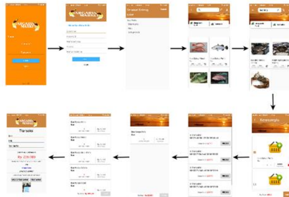
Gambar 1 Proses yang terjadi dalam Sistem argaria Market Mobile

Dari hasil pengamatan pada object penulis mengumpulkan sampel data Nelayan yang berada di kep. Aru. Di kepulauan aru hampir sebagaian besar penduduk memiliki profesi sebagai nelayan dan penulis memilih 4 orang Nelayan sebagai bahan perbandingan pada penelitian ini. Pada aplikasi ini terbagi menjadi dua bagian, bagian user dan bagian admin. Pada bagian user sistem yang tersedia ialah berbasis mobile, proses yang terjadi pada sistem user dapat dilihat pada gambar 1.